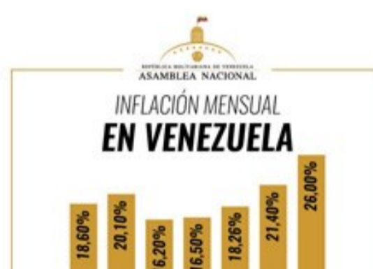
Parlamento calcula inflación de julio en 26%