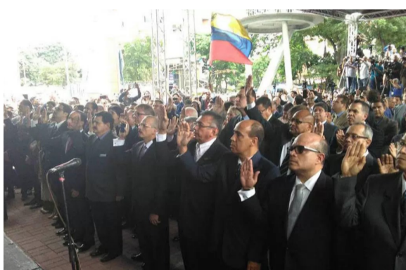
¿Qué pasó con los magistrados designados por la AN?

A pesar de la activación de la ANC, el autoritario uso del salón protocolar del Palacio Federal apoyado por la GNB y las restricciones impuestas a los diputados para ingresar al Parlamento, estos continuaron en ejercicio de sus funciones y aprobaron dos proyectos de acuerdo. Uno en rechazo al decreto de la nueva asamblea chavista y sus pretendidas facultades respecto a poderes constituidos y el otro con motivo a la firma de la Declaración de Lima para la defensa y restitución del orden constitucional de Venezuela.