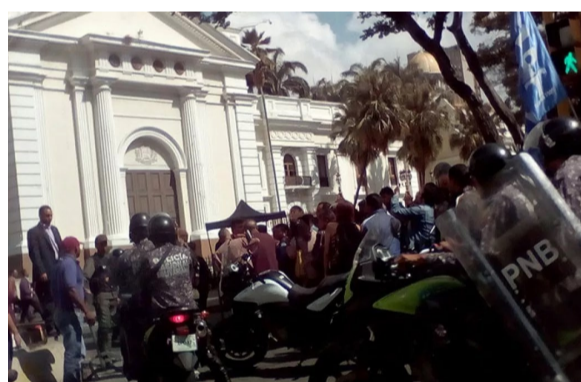
Funcionarios de la GNB impiden ingreso de Diputados a la Asamblea Nacional