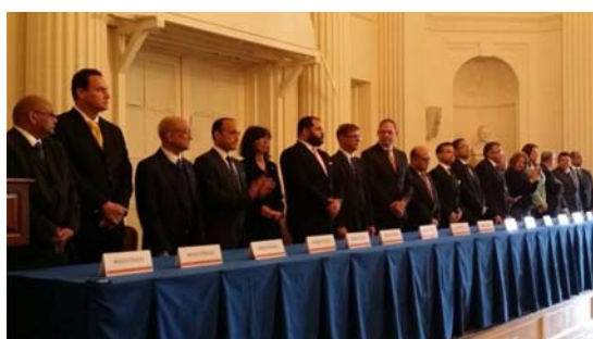
TSJ designado por la AN emprende nuevo camino con apoyo internacional