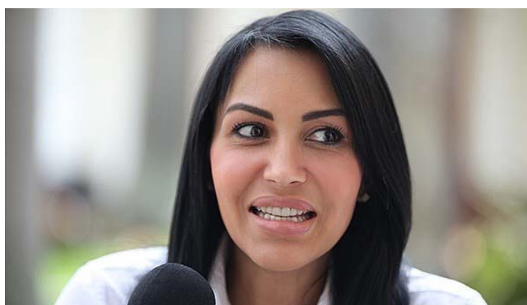
Unión Interparlamentaria designa a Delsa Solórzano vicepresidente de la comisión de DDHH

Luego de los comicios de gobernadores celebrados el pasado 15 de octubre, el Legislativo convocado en sesión ordinaria aprobó un acuerdo en rechazo al “proceso fraudulento de elecciones” impulsado por órdenes del Gobierno Nacional. En este sentido los parlamentarios denunciaron el hecho argumentando tener pruebas de los tipificados delitos electorales cometidos, además exhortaron a que el Consejo Nacional Electoral sea reformado por sus repetidas posiciones evidentemente partidistas, por lo cual fue ratificado el procedimiento para la designación de los nuevos rectores del Consejo Nacional Electoral (CNE) a cargo de la Comisión de Política Interior.