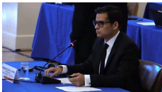
Diputado Armando Armas denuncia agresiones contra la AN ante la OEA