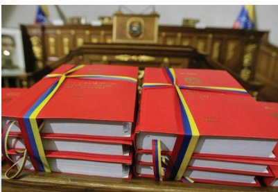
PRESUPUESTO 2019 (TOTAL)

El presupuesto destinado al Carnet de la Patria para 2019 fue: