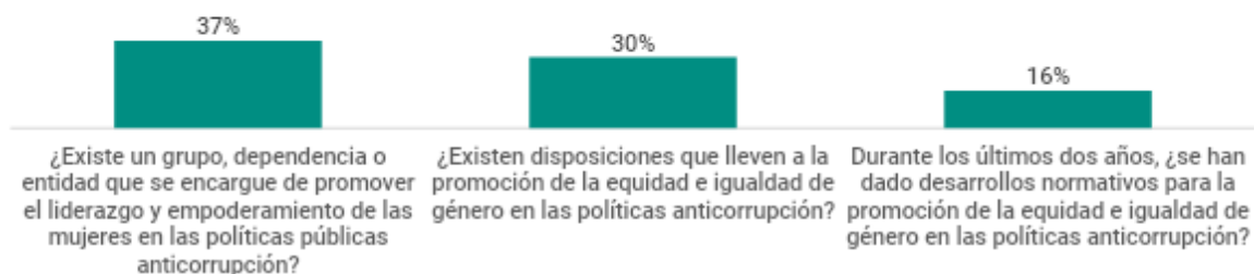
Gráfico No 2. Valoraciones Positivas en Indicadores Normativos Compromiso No 7 Avance en Indicadores Normativos Compromiso No. 7 Equidad e Igualdad de Género y Políticas Anticorrupción